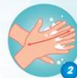
Chà lòng bàn tay này lên mu bàn tay kia và ngược lại