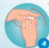
Chà một ngoài các ngón tay của bàn tay này vào lòng bàn tay kia