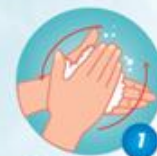
Chà hai lòng bàn vào nhau