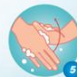
Chà ngón tay cái của bàn tay này vào lòng bàn tay kia và ngược lại