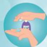
Bơm 3 - 5ml dung dịch vào lòng bàn tay