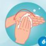
Chà các đầu ngón tay này vào lòng bàn tay kia và ngược lại

- Từ bước 1 đến bước 6: Thực hiện mỗi bước 5 lần - Làm ướt tay trước khi sử dụng. Rửa lại tay bằng nước sạch và lau khô.